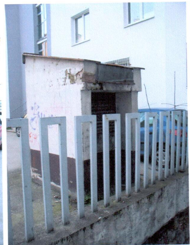
Príklady na nadzemnú časť malých vetracích šachiet nad chodbou a druhou technickou miestnosťou. Narušená hydroizolácia, najmä v styku vodorovnej izolácie stropu a zvislej izolácie stien.