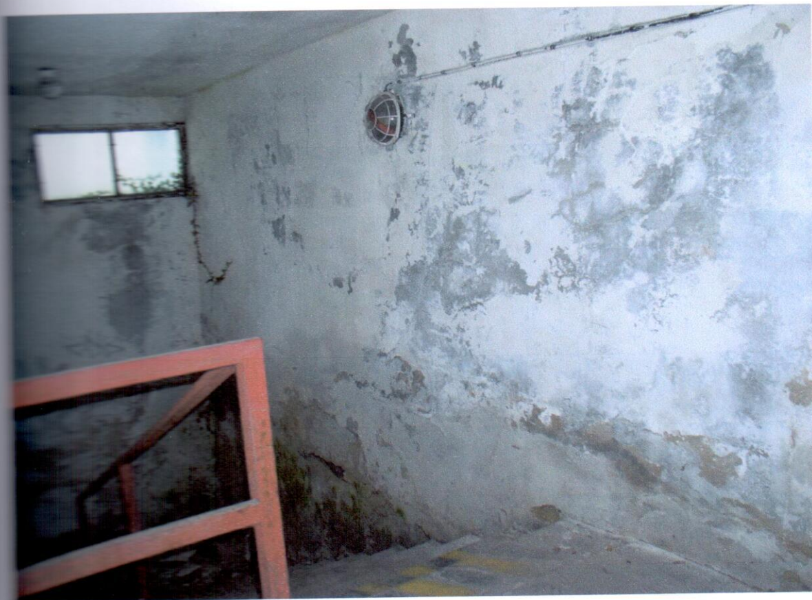
Schodiskový priestor v nadzemnej časti, nefunkčná hydroizolácia, v pozadí vonkaša vegetácia prerastajúca oknom, detail schodiskového zábradlia.