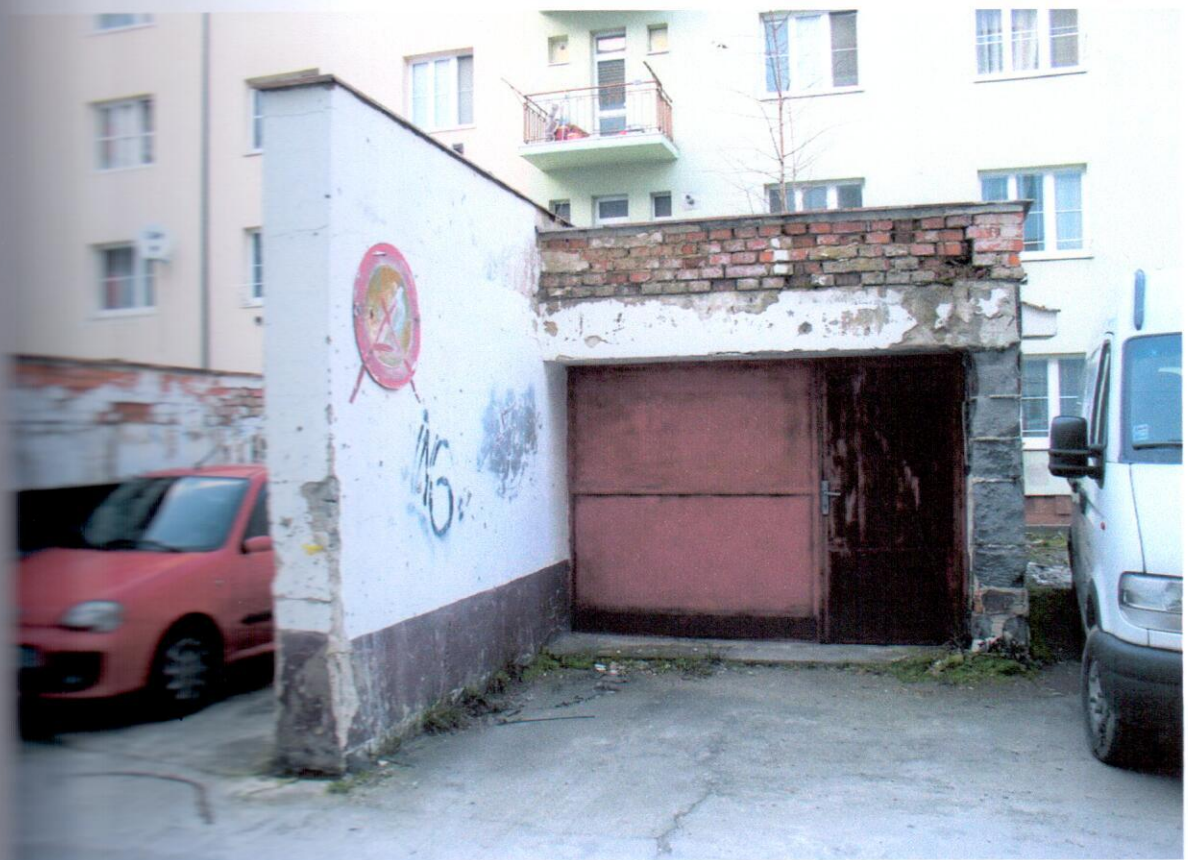
Pozitív na východ zo schodiska z vonkajšej strany, stopy deštrukcie muriva a atiky.