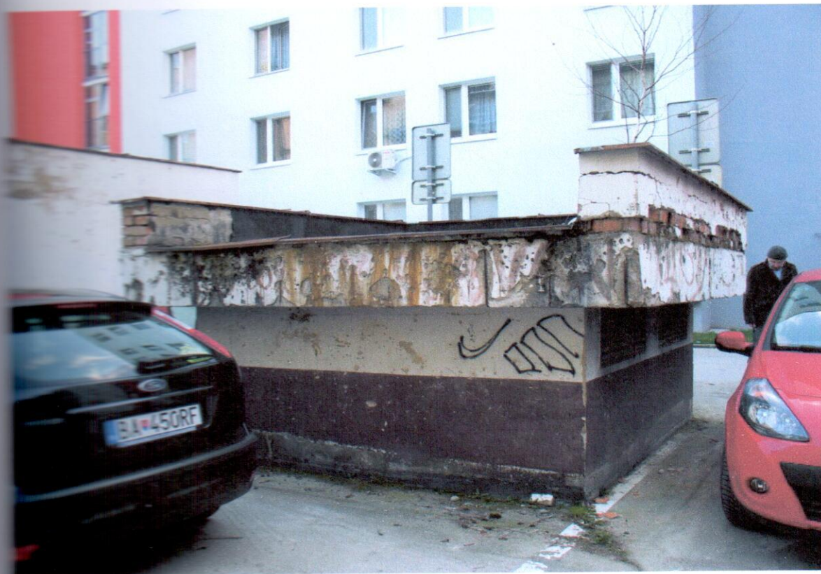
Nachemná časť hlavnej vetracej šachty, nefunkčná hydroizolácia, murivo atiky odtrhnuté od stropnej dosky, náletová zeleň, obnažená výstuž stropnej dosky