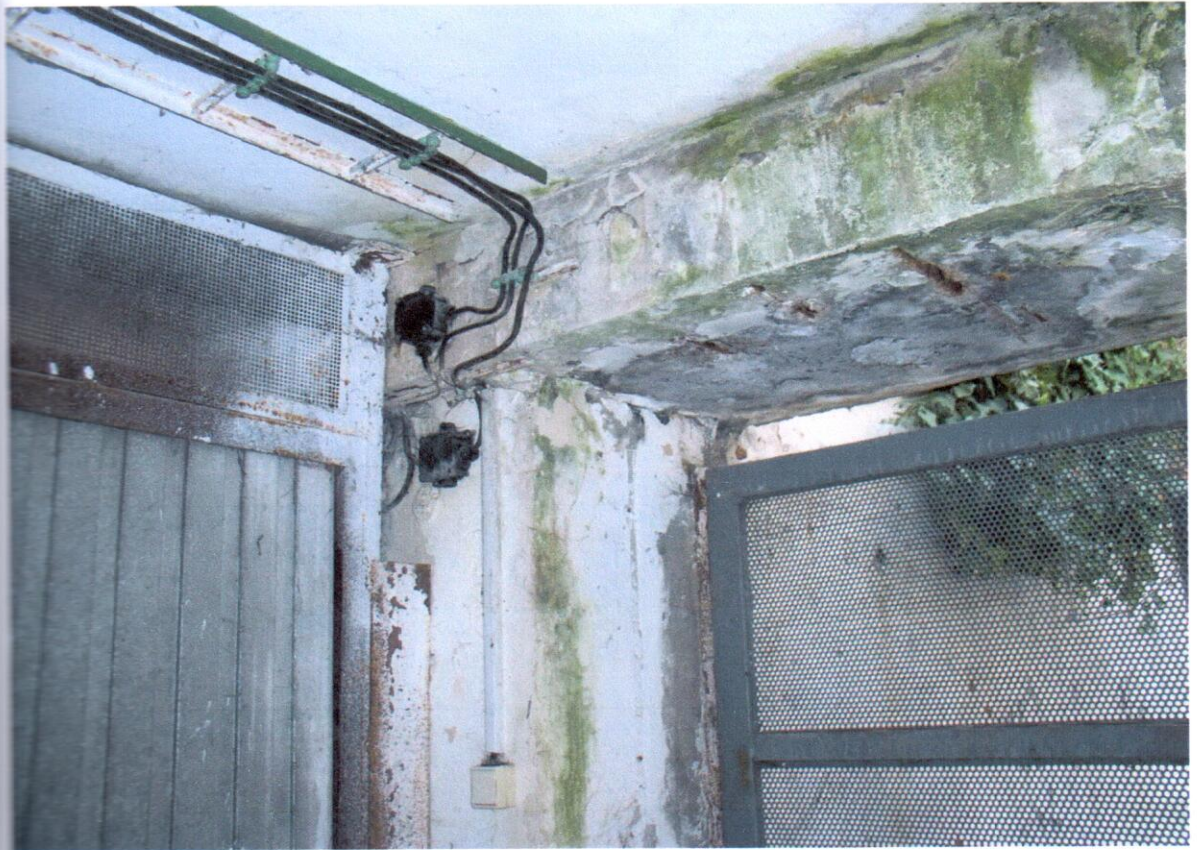
Detail prievlaku nad vstupom, obnažená výstuž, plieseň, zelené riasy. Vľavo brána garážového boxu, nosná konštrukcia skorodovaná, brána z pozinkovaného plechu.