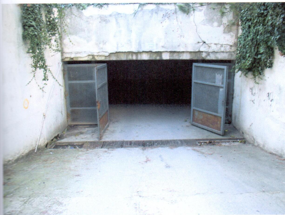
Obnažený prievlak nad vstupnou bránou, odvodňovací žľab zanesený, nefunkčný.