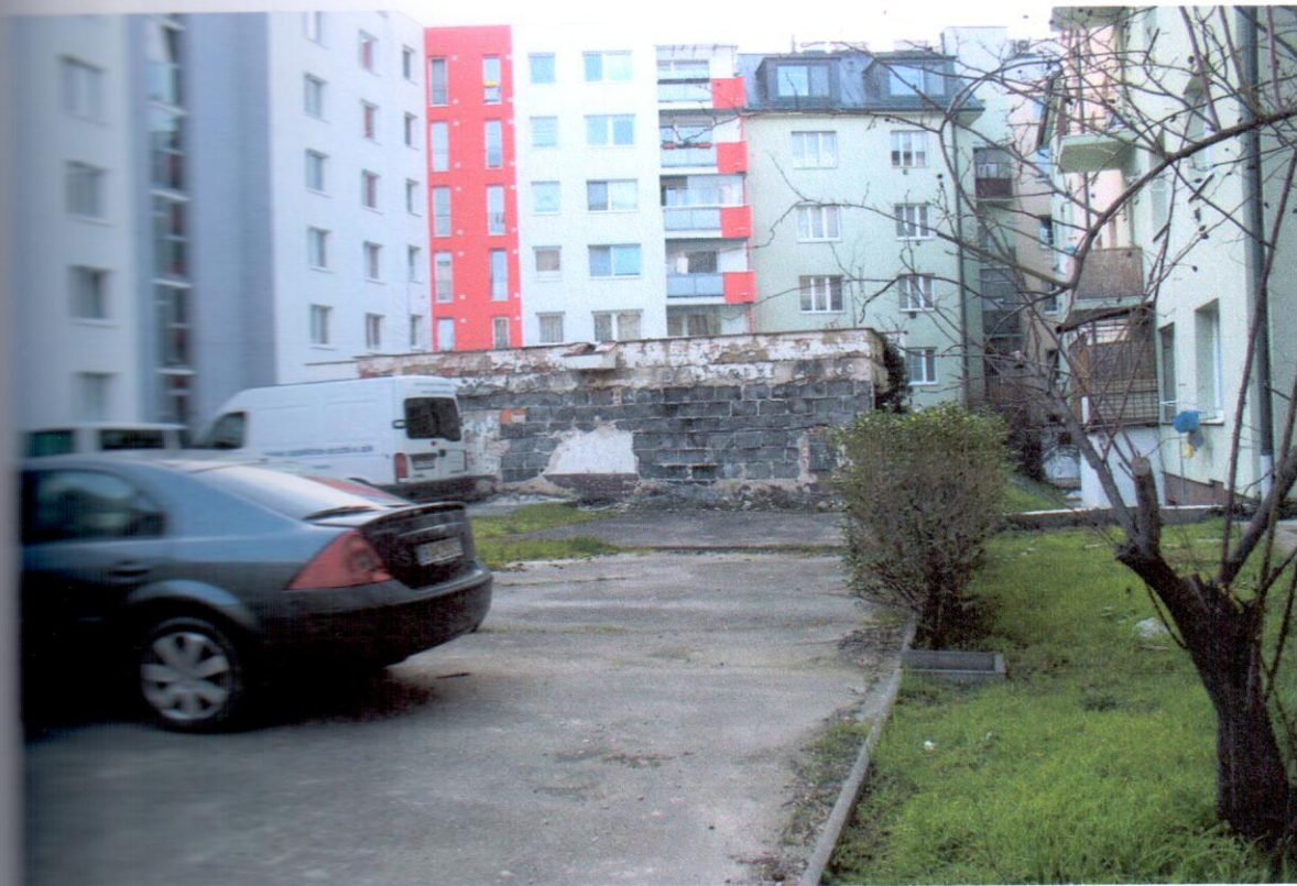
Čiarkový pohľad na schodiskový blok z pórobetónových tvárnic.