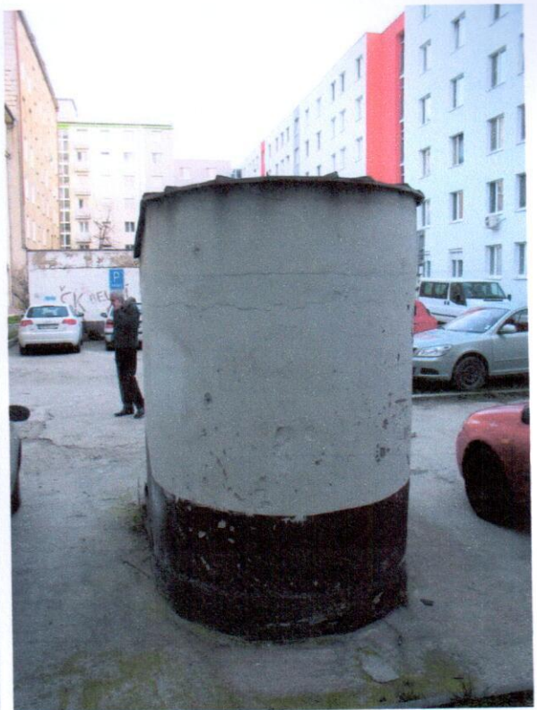
Príklady na nadzemnú časť malej vetracej šachty nad technickou miestnosťou.