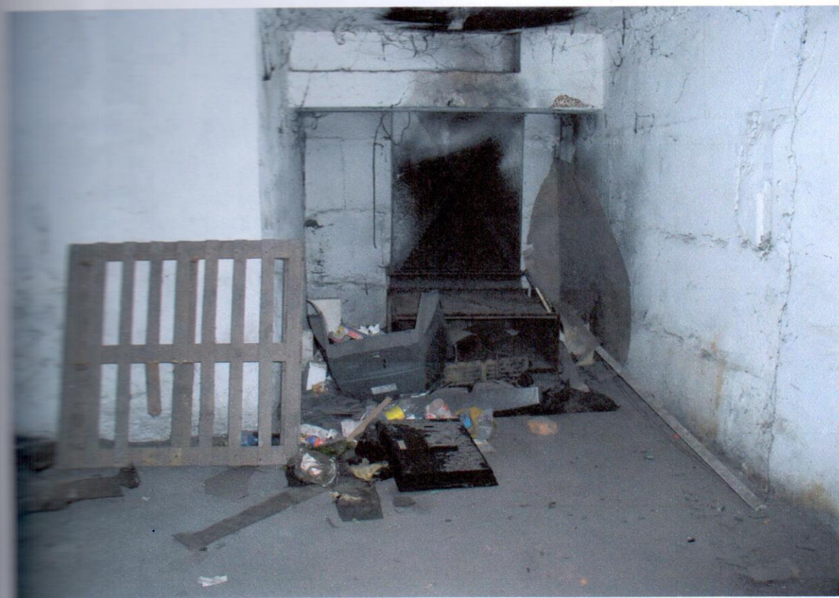
Porušenie do chodby pod malou vetracou šachtou so vzduchotechnickým potrubím.