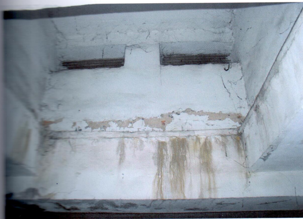
Prenikajú do vetracej šachty z vnútornej strany. Stopy prenikania vody do stavby.