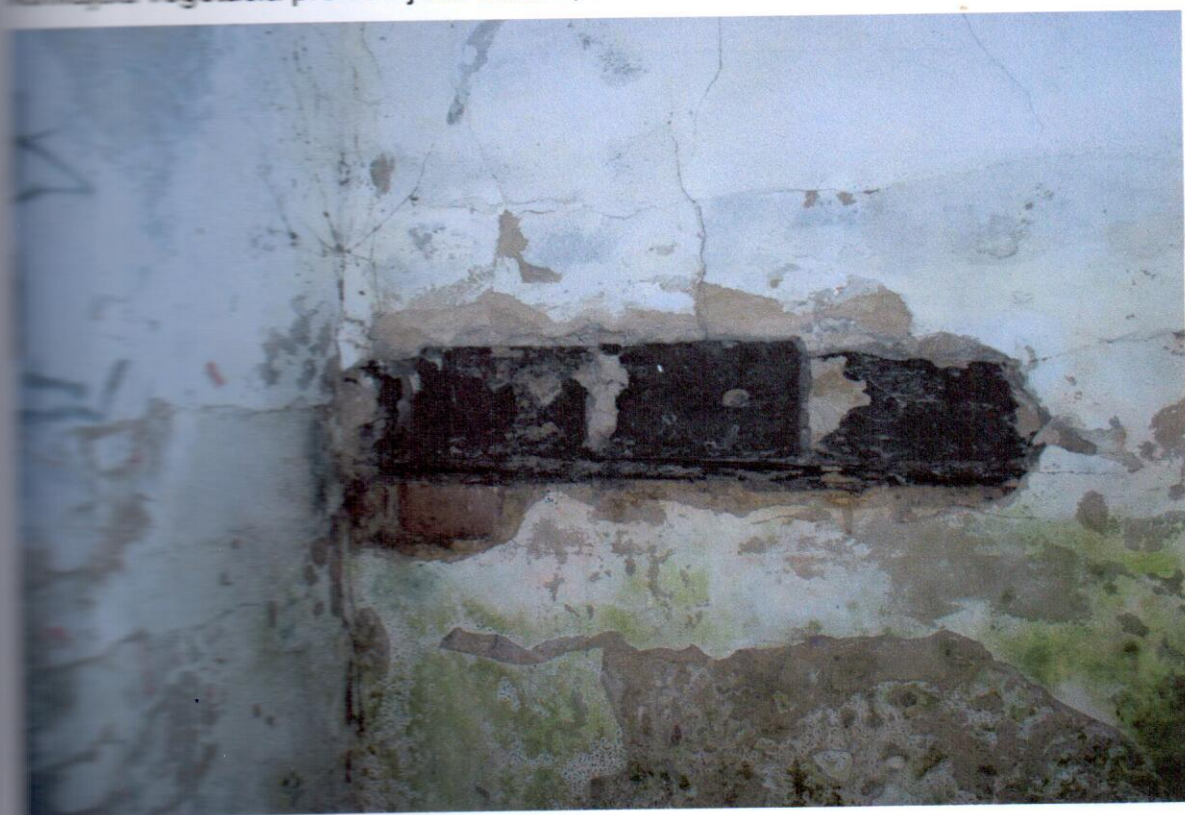
Detail porušenia hydroizolácie pri styku vodorovnej (stropu) a zvislej (stien) v schodiskovom priestore. Stena napadnutá plesňou a zelenými riasami.