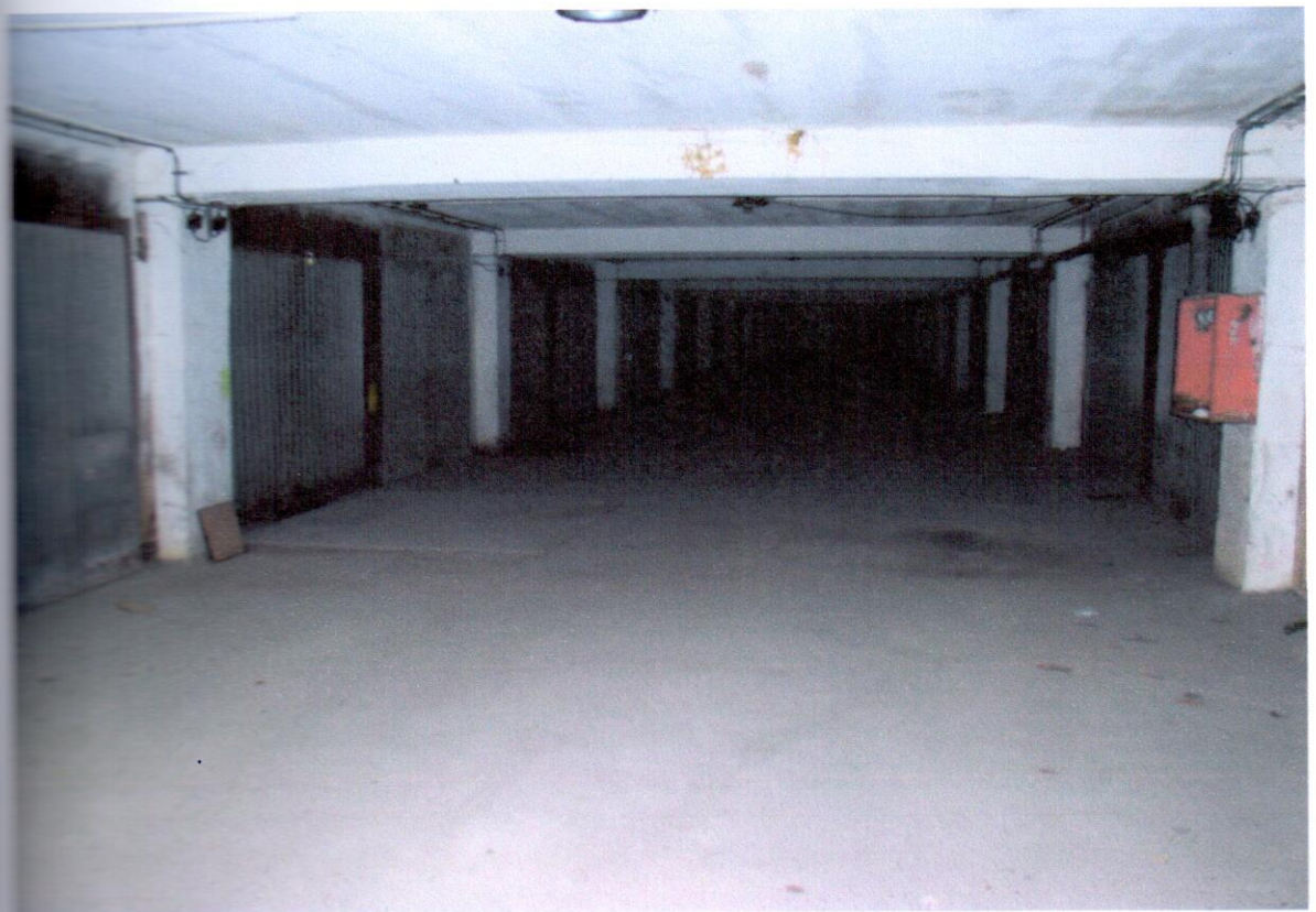
Pohľad do stredného modulu stĺpovej nosnej sústavy. Vpravo zbytky hydrantu.