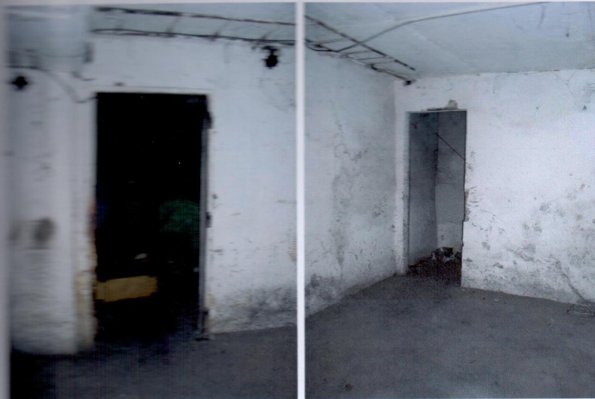
Porušenie na technické miestnosti so zbytkami vzduchotechnického zariadenia.