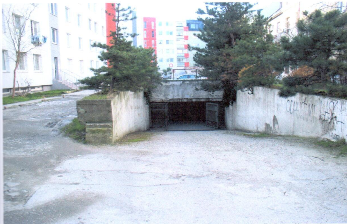
Betónová vjazdová rampa bez priečneho odvodňovacieho žľabu v najvyššom bode, okolitý terén vyspádovaný k rampe. Povrch zvetralý bez poškodenia jadra.