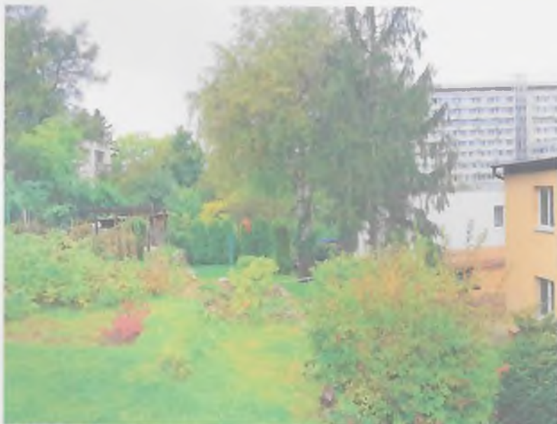
p.č. 5494_1 a 5494_72