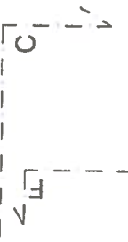
Pôdorys 1 NP - NOVÝ STAV m = 1:100