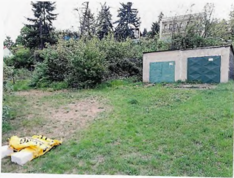
Pozemok registra „C“ KN, parc. č. 5348/3, k. ú. Vinohrady, obec: BA – m. č. Nové Mesto, okres: Bratislava III