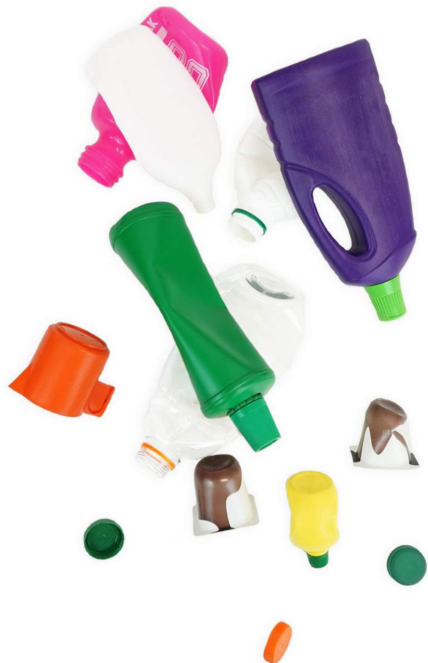
01 projekt recyklačnej dielne