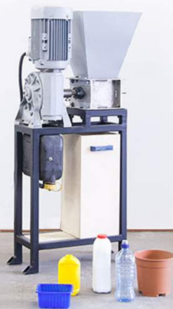
01 projekt recyklačnej dielne